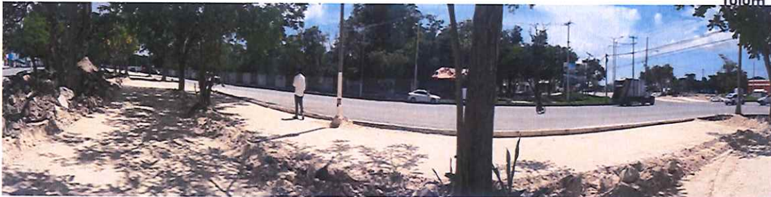
Av. Chac Mool con Av. 20 de Noviembre