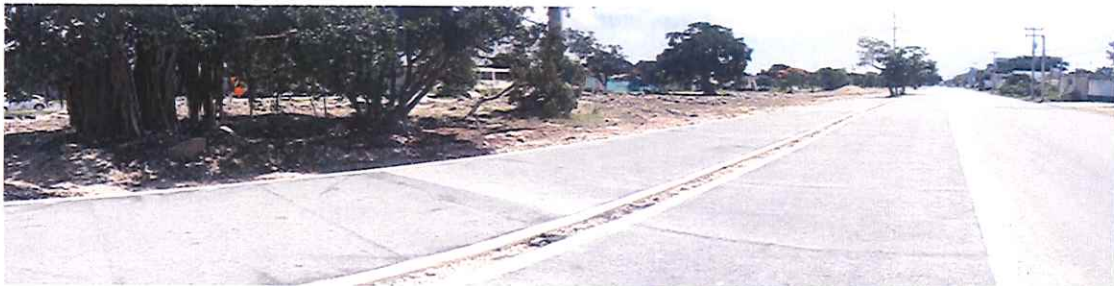
Av. 20 de Noviembre con Av. Prolongación Tulum