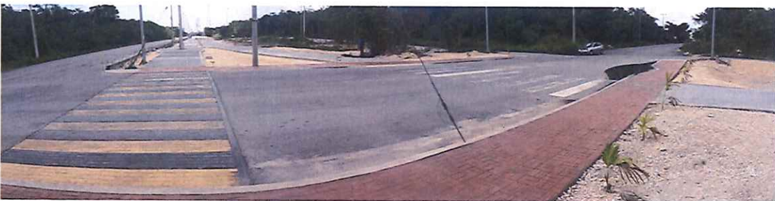
Av. Cancún con Av. 145